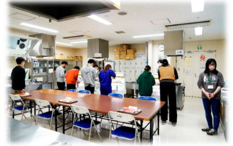
【競技（部分肉・精肉部門）】