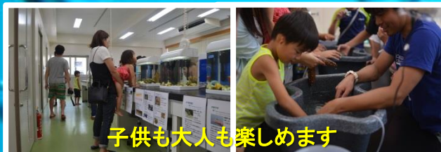
子供も大人も楽しめます

開催時間：午前 9時～午後 17時まで(ただし、3日は15時まで) 新型コロナウイルス等の状況により、中止とする場合もあります。ご了承ください。