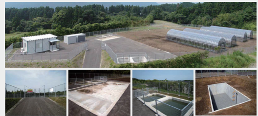
図2 宮崎大学開放系栽培研究ほ場

現在、我が国は、多くの遺伝子組換え作物を輸入しており、その安全性評価が大きなテーマとなっています。本研究では、遺伝子組換え作物の生物多様性影響評価システムを温室レベルで確立しており、また、本学は、より自然条件下で組換え体の評価を行える開放系栽培研究ほ場を保有しているため、ほ場レベルでの評価法の確立を行ってきました。遺伝子組換え体を栽培できる開放系のほ場は、全国でも数少なく、開発した組換え体の評価だけでなく、企業との共同研究も進めている。