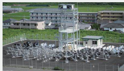
図1 ビームダウン式太陽集光装置

通常のタワー型太陽集光装置は、被加熱物へ斜め下から太陽光を照射しますが、宮崎大学に設置されているビームダウン式太陽集光装置(BDSC, 図1)は、真上から太陽光を照射します。太陽光の照射方向が違くと、太陽光受光装置(レシーバ)内を通る熱媒体の流動方法を変えないといけなため、既存のレシーバをそのまま流用することができません。そのため、BDSC で使用する際に十分な性能を発揮するレシーバを開発し、実験による評価を行う研究を進めています。