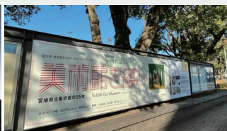
◎ワタナベカシオ ●宮崎県立美術館ビジュアルデザイン