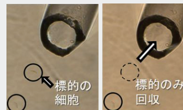
単細胞操作の様子

植物の受精機構を理解することは、交雑育種・種子生産にとって非常に重要です。私達は、オス側である花粉に注目し、受精に至る過程を研究しています。花柱や子房の中を伸長する花粉管、さらにその花粉管内の雄性配偶子の働きを調査することは困難ですが、人工的に花粉管を誘導し、花粉管からの雄性配偶子単離法、また単一細胞における解析技術を開発することで、雄性配偶子の詳細な解析を可能としました。受精後の胚発生過程の解析を通じて、新たな育種法の開発に取り組んでいます。