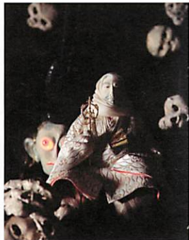
「清盛浄海」平家物語