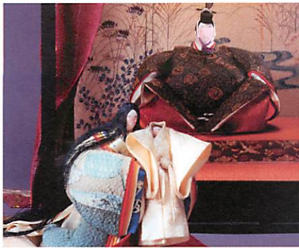
「若君の誕生」源氏物語