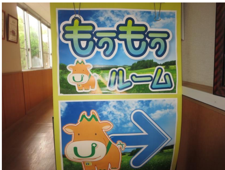
もうもうルームはこちら（会議室）

昼休みには会議室が、「もうもうルーム」に変わります。ここでは、校長先生や教頭先生、時々宮大生と一緒に、勉強したり話をしたりすることができます。教室とは違う雰囲気、ちょっと一息つける癒しの空間です。