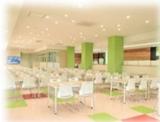
福利厚生棟 1F 食堂