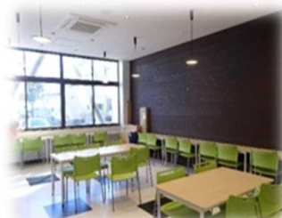
講義棟 1F 売店