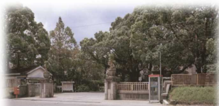
昭和60年：旧農学部正面

宮崎大学農学部は、1924年（大正13年）に設立された宮崎高等農林学校に始まり、その後、1944年（昭和19年）に宮崎農林専門学校に、1949年（昭和24年）に宮崎大学農学部となり、1984年（昭和59年）に現在の宮崎市学園木花台に移転し、2024年（令和6年）に、創立100周年を迎えます。