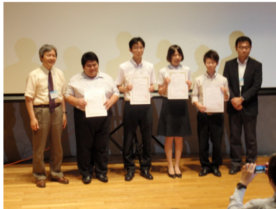
授賞式（左から二人目）