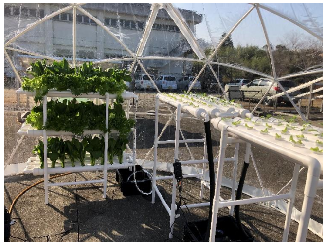
太陽光エネルギーおよび畜産廃棄物を活用したエネルギー・農資源循環型実証システム