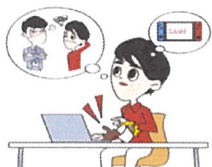
注意力が散漫になる