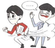
空気が読めない時がある