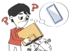
失くし物がよく起こる