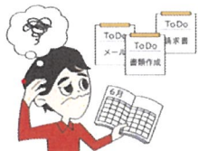
順序立ててが苦手だ