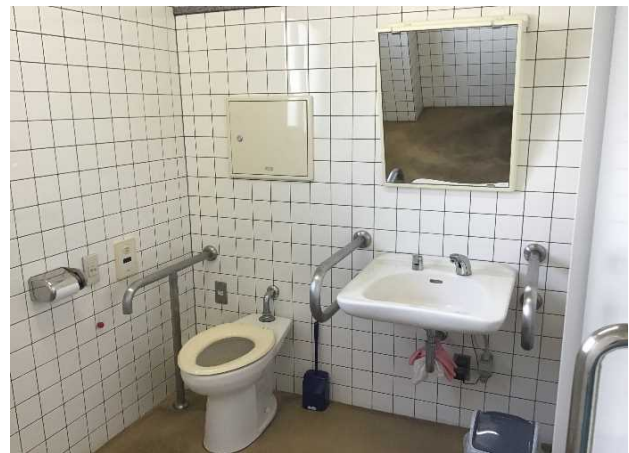
1階 多目的トイレ内部