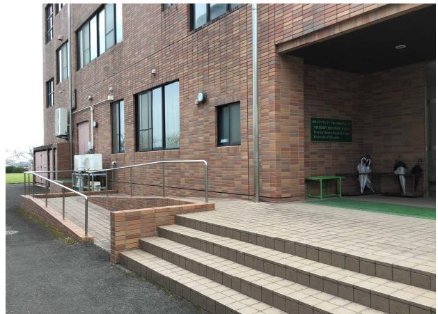
正面玄関ースロープ