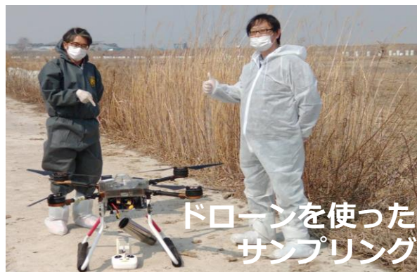
ドローンを使ったサンプリング