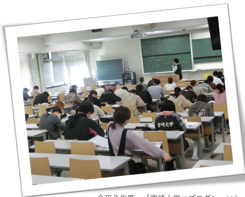
令和3年度 「宮崎大学×プログレッション」 による教員採用試験対策講座