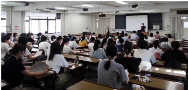
二次対策講座説明会