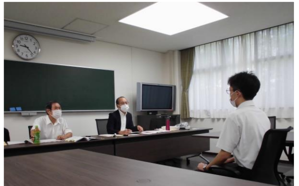
木犀会(教育学部同窓会)による 二次対策講座