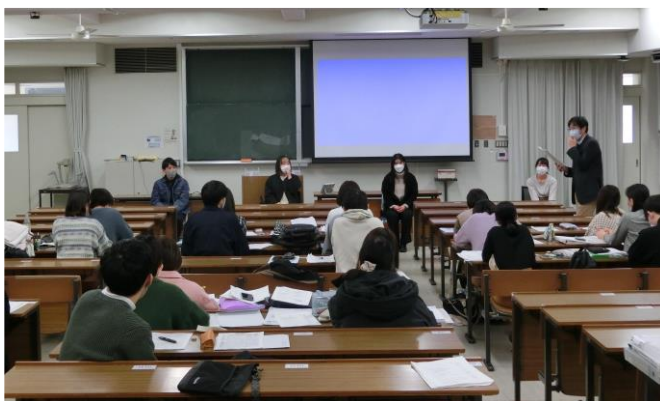
教職パワーアップ集中セミナー