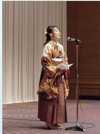
卒業生・修了生代表挨拶