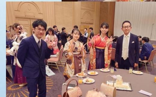
食事を楽しむ卒業生

3月23日にフェニックスシーガイアで卒業式・修了式が開催されました。学部生125名が卒業、大学院生16名が修了しました。