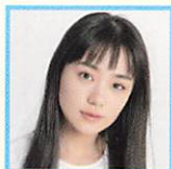
奈緒 俳優 他