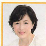
水野真紀 俳優 他