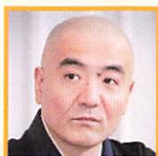
玄侑宗久 作家 / 福聚寺住職