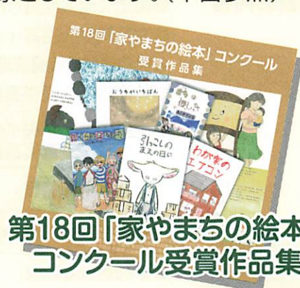
第18回「家やまちの絵本」 コンクール受賞作品集