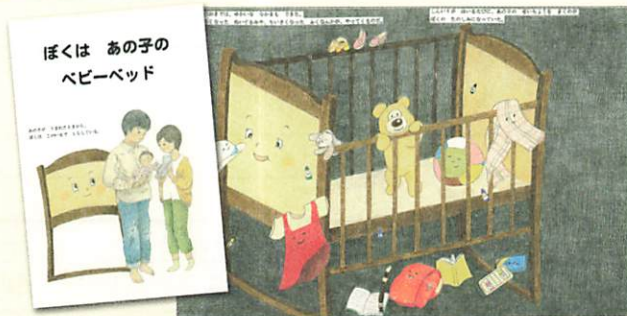
「ぼくは あの子の ベビーベッド」 平尾 郁穂