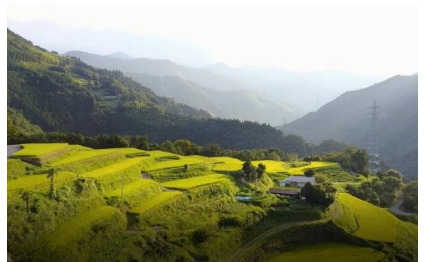
山岳地帯の棚田（仙人の棚田：椎葉村）