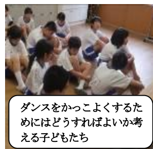
ダンスをかっこよくするためにはどうすればよいか考える子どもたち