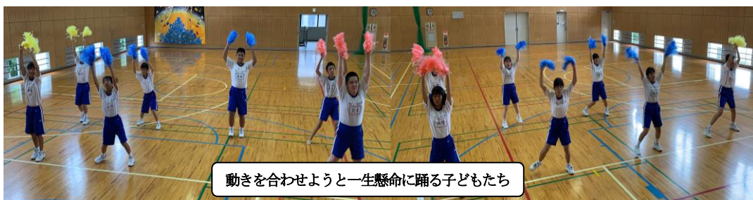
動きを合わせようと一生懸命に踊る子どもたち