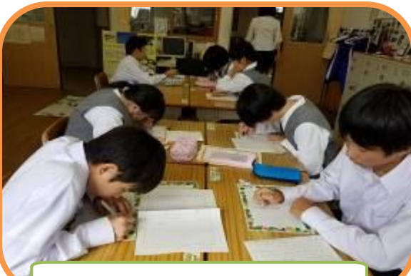
パネルの文章作り