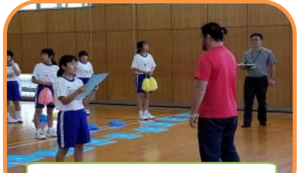
遠坂先生とのダンス練習