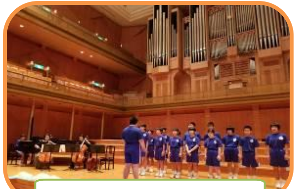
橋祭 E級リハーサル