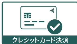
クレジットカード決済