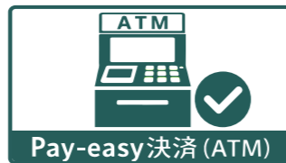
Pay-easy 決済 (ATM)

宮崎大学基金ウェブサイトの「寄附のお申し込み」からお申し込みいただけます。（但し、研究等支援事業基金を除く）