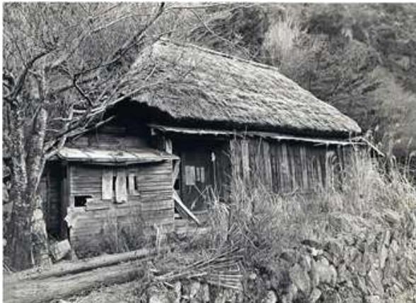
家族7人が死んだ喜右衛門屋敷