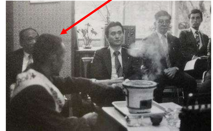
土呂久初訪問の 松形知事を案内