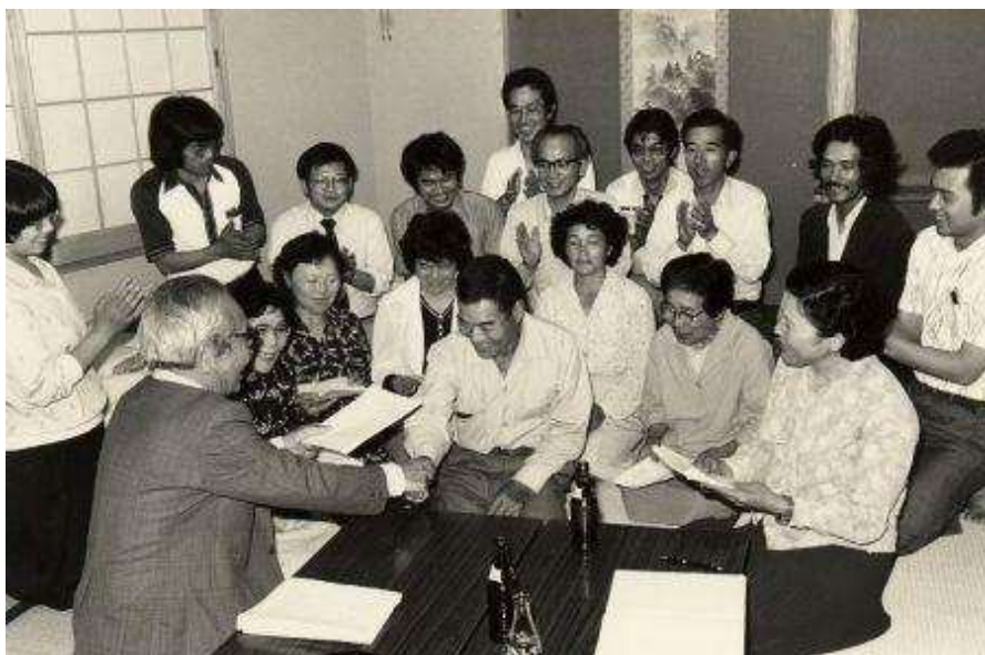
1980年土呂久公害の被害者と