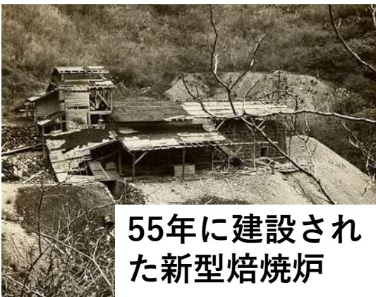
55年に建設された新型焙焼炉