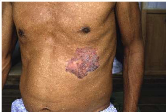
慢性ヒ素中毒の患者の皮膚に残るポーエン病