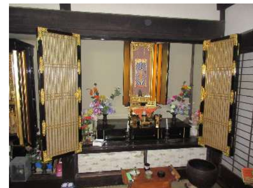
講元の家には「土呂久講中の仏壇」が置いてある