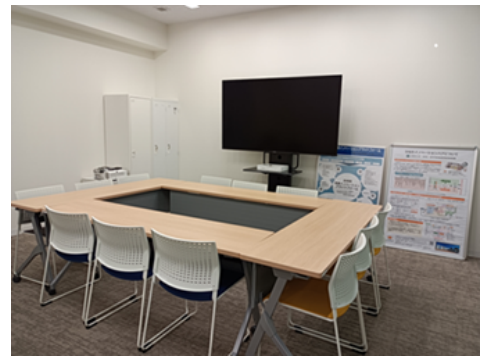
▲ひなたイノベーションHubの相談室 企業の相談者や大学等の研究者の方のプレゼン効果を高めるため、相談室に大型モニタを設置