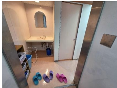
トイレ(女子寄宿舍)