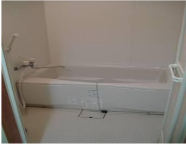
お風呂(国際交流宿舎 I)