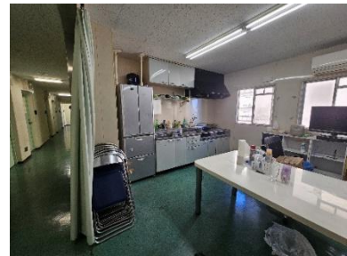
補食室(男子・女子寄宿舍)