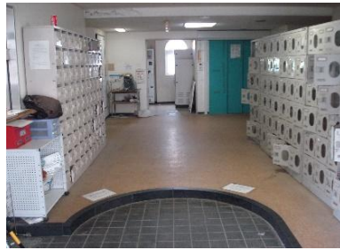
玄関(国際交流宿舎 I)