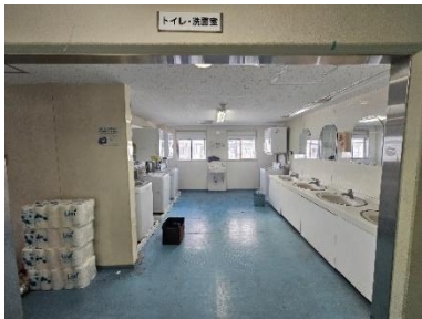
洗濯室(男子寄宿舍)