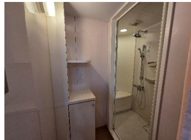
シャワー室(男子・女子寄宿舍)