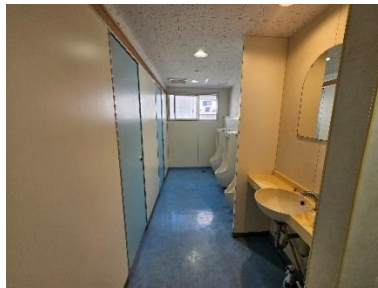
トイレ(男子寄宿舍)