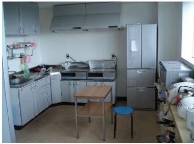
補食室(国際交流宿舎 I)