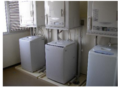
洗濯室(国際交流宿舎 I)