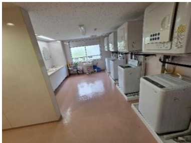
洗濯室(女子寄宿舍)