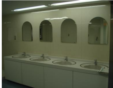
洗面所(男子・女子寄宿舍)