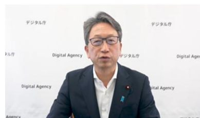
平 国家公務員制度担当大臣(当時) 開講挨拶