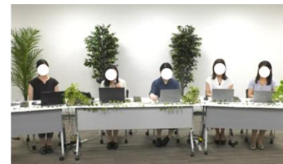
パネルディスカッション (内閣人事局)