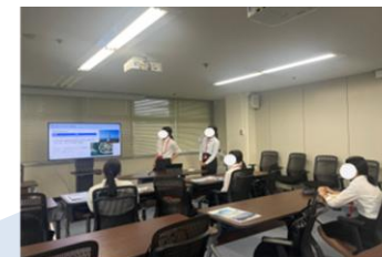
政策の企画・立案プロセス 体験