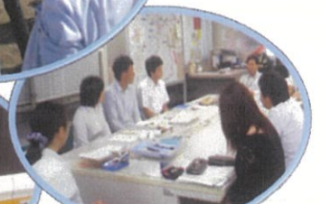
若手職員との意見交換