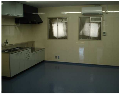
補食室(男子・女子寄宿舎)