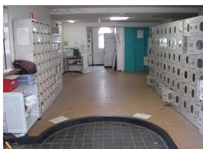
玄関(国際交流宿舍Ⅰ)