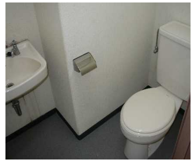
トイレ・洗面(国際交流宿舎 I)