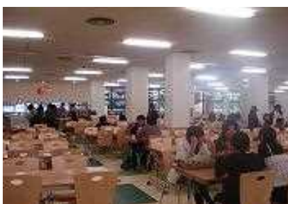
④ 大学会館内の学生ホール (食堂)