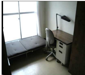
居室(国際交流宿舎 I)