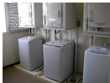
洗濯室(国際交流宿舍Ⅰ)