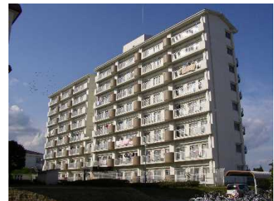
③ 国際交流宿舎 I