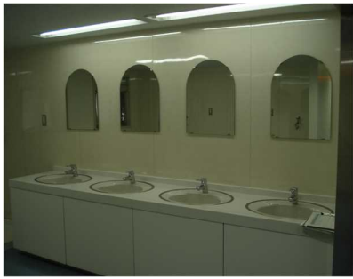
洗面所(男子・女子寄宿舎)