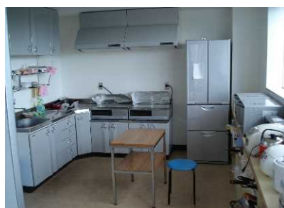
補食室(国際交流宿舍Ⅰ)