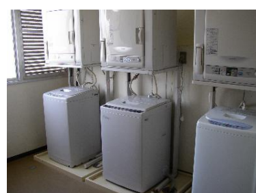
洗濯室(国際交流宿舍 I)