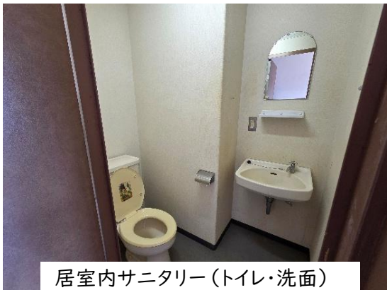
居室内サニタリー(トイレ・洗面)