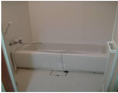
お風呂(国際交流宿舍Ⅰ)