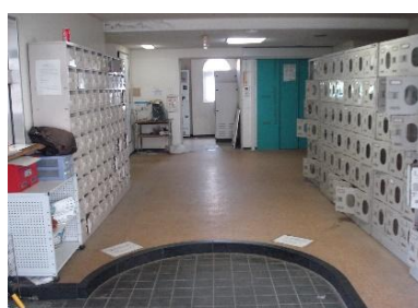
玄関(国際交流宿舍 I)