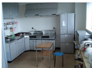
補食室(国際交流宿舍 I)

・ベッドは各寮とも下記の寸法の折りたたみベッドとなります。ベッド寸法 990×2090×480 mm (幅×奥×高) ・吊り棚寸法 (男子・女子寄宿舍のみの設備となります) 3850×2150×500 mm (長手方向×短手方向×幅)