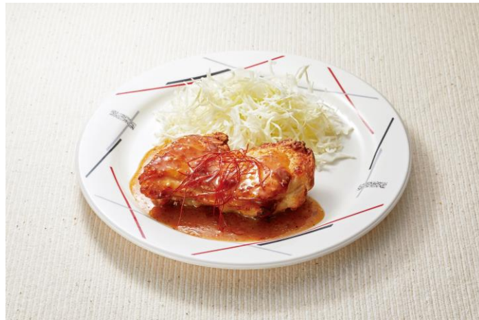
10月18日（水） 怪味鶏（ガイウェイチー）