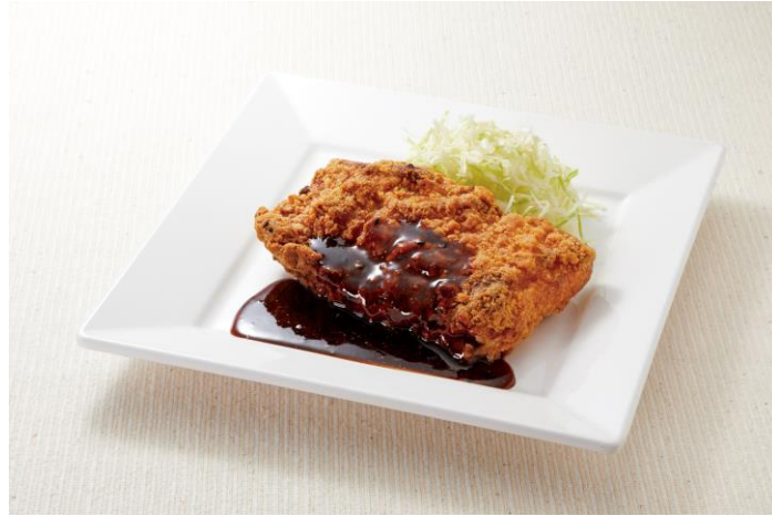
10月4日（水） チキン甘辛ステーキ