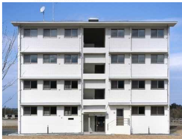
Building Exterior 建物外観