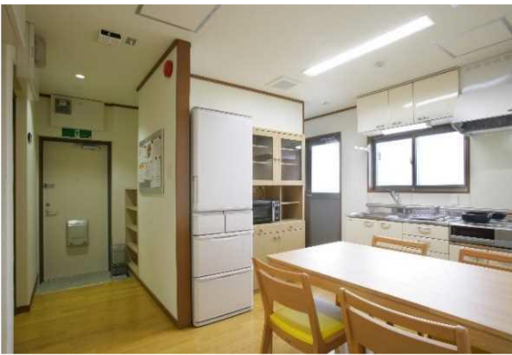
間取り Room Layout