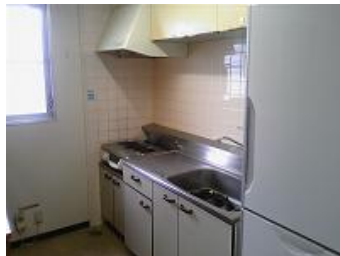
国際交流宿舎Ⅱ 台所