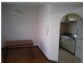
国際交流宿舎Ⅱ 居室