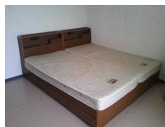
国際交流宿舎Ⅱ 寝室