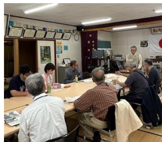
昨年度公開講座の様子

土呂久を散策し、自然や歴史・文化など、土呂久がもつ稀有な魅力を体験しその価値や大切さについて、高千穂・土呂久にゆかりの方たちと一緒に考えませんか。