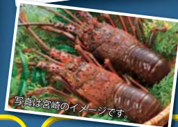
写真は宮崎のイメージです。