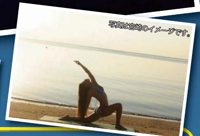
写真は宮崎のイメージです。