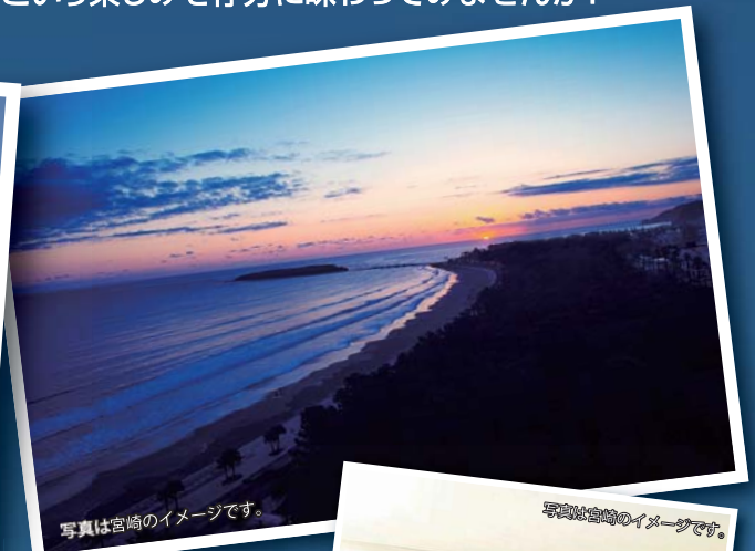
写真は宮崎のイメージです。