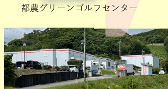
都農グリーンゴルフセンター

ニッポンハムグループで、養鶏・鶏肉を担当するグループ。都農町にあるのは孵卵場で種鶏農場から出荷された受精卵を雛に孵す作業、生まれた健康な雛を委託生産農家に届ける作業などを行なっている。