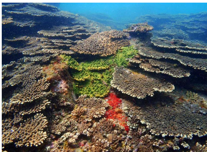
図1. 20-30年前には海藻類が繁っていた場所が今は様々な種のサンゴで覆われている（宮崎県・串間市）