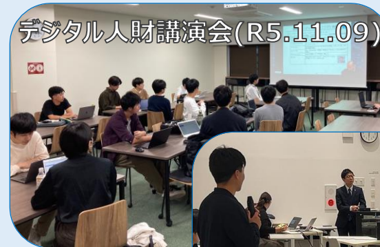
デジタル人財講演会(R5.11.09)