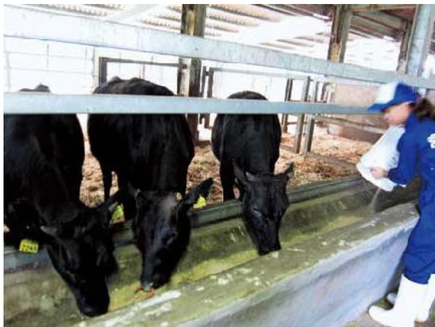
附属住吉牧場でのウシの飼養管理実習風景

のうがく図鑑: https://www.miyazaki-u.ac.jp/agr/books/book-ags/post-24.html