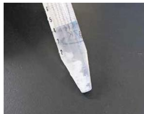
ウシから抽出したゲノムDNA