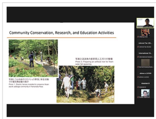
オンライン講義の様子