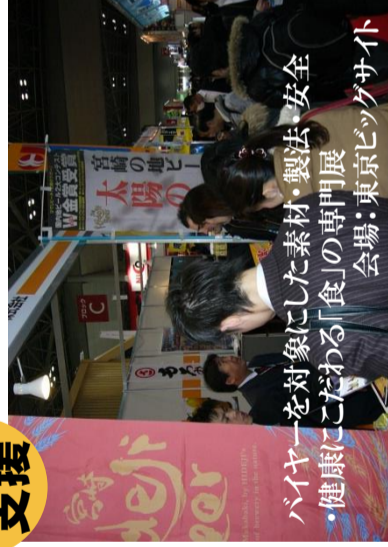
バイヤーを対象にした素材・製法・安全 ・健康にこだわった「食」の専門展 会場：東京ビッグサイト