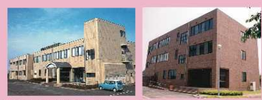
(産学・地域連携施設) (機器分析支援施設)