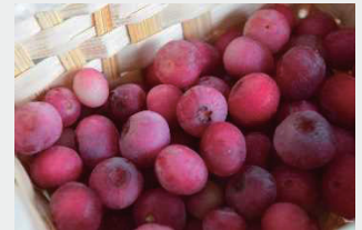
図 1 赤いブルーベリー

ブルーベリーやラズベリー等のベリー類は人気が高く、特産果樹として注目されています(図 1)。しかし、そのほとんどの品種は海外から導入された品種が多く、日本の温暖な気候に合ったものが少ないことから地域によっては栽培が困難です。そこで、日本に自生している里山植物を育種素材として、アントシアニン等の機能性成分を豊富に含み、減農薬栽培が容易な品種の育成を行っています。